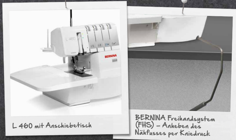
L 460 mit Anschietisch

Der gut ausgeleuchtete, grosse Arbeitsbereich dieser Overlocker erleichtert das Nähen und Einfädeln von Greifer und Nadeln. Dank des Freihandsystems (FHS), über welches der Nähfuss angehoben und gesenkt werden kann, bleiben beide Hände frei für das Nähen und Führen des Stoffs. Der Anschietisch erweitert den Arbeitsbereich und erleichtert das Umsetzen grosser Nähprojekte.